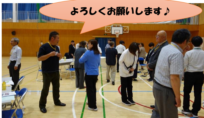
委員と教職員との自己紹介の様子

地域内のつながりが希薄化する中、学校を核として地域の人たちが集まり、子供たちを育成することを通じてよりよい地域づくりにつなげていくことがねらいです。大室小では、各自治会長様を中心に16名の委員が日光市から任命されています。「大室が大好き」な子供たちを皆で育てていきます。どうぞよろしくお願いいたします。