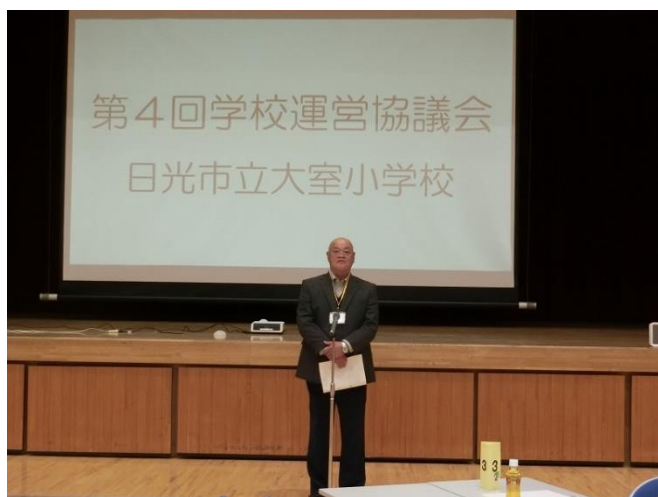
▲ 根本会長から御挨拶をいただきました。一年間、ありがとうございました。

という特徴があります。本校の子供たちがそのような力を身に付けることは、校長の熱い願いでもあり、全教職員が目指す大きな目標でもあります。教職員による日頃の授業づくりや行事の実施等に加え、委員の皆様のアイデアを結集して、“自分が大好き”な子供たちを地域ぐるみで育てていくための方策を話し合っていました。