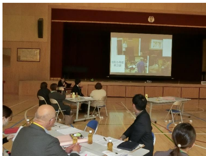
▲ 校長が「後期学校評価」について説明しました。