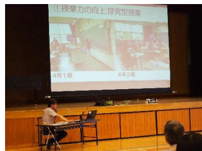
▲校長による「学校経営の基本方針」の説明