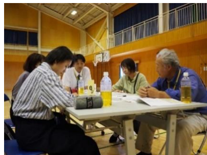
▲意見を交わす委員と教職員

「授業力の向上」「安全・安心な学校環境づくり」「教師の資質・能力の向上」の実現によって 「児童の学力向上」「児童の安全性・快適性の確保」「児童の質の高い教育活動」 を目指します！