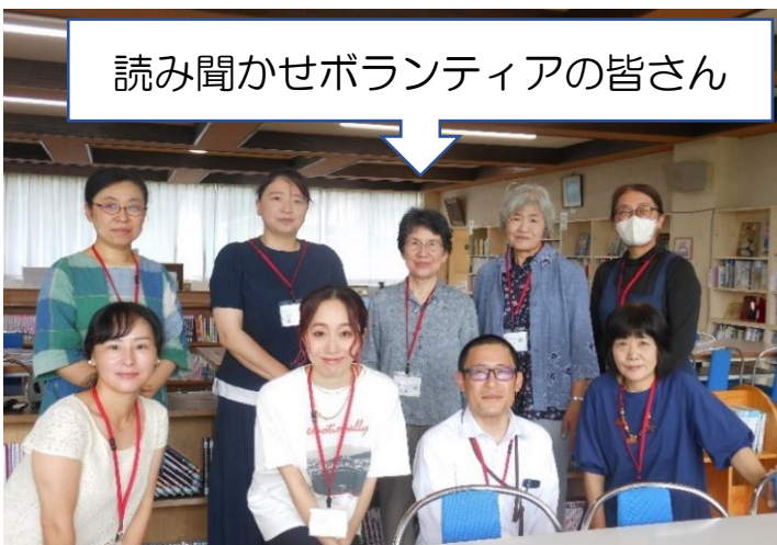
読み聞かせボランティアの皆さん

「参加してみたいけれど、自信がない」という方は、是非、見学に来てください。読み聞かせのメンバーは、随時募集していますので、いつでもお申し込みいただけます。