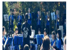
ニコニコ本陣10周年記念イベント