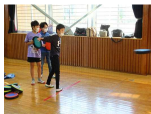
ディスクゲッター