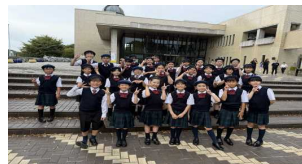
上都賀地区学校音楽祭