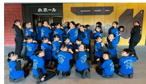
日光市学校音楽祭