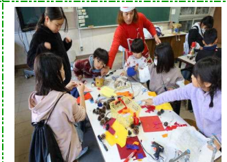
松ぼっくりアート