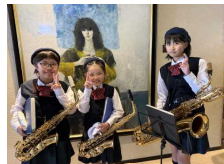
栃木県学校音楽祭中央祭