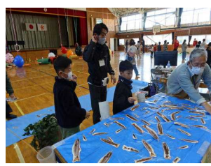
イワナ模型釣り体験