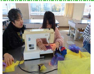
ニードルミシンを使った小物作り