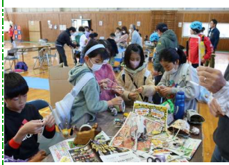
広告の紙で遊ぼう