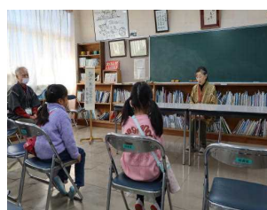
民話語りを楽しもう