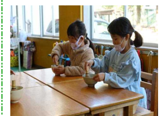
お抹茶を楽しもう