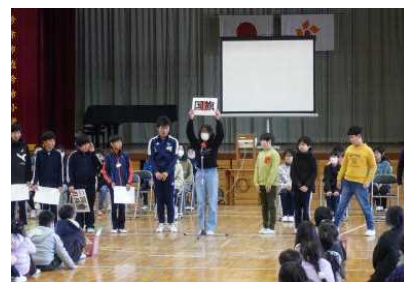
6年生から5年生への引き継ぎ