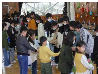
6年生へのプレゼント