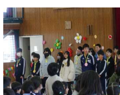
6年生から御礼のあいさつ