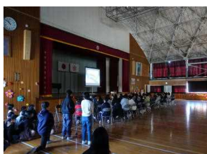
6年間の思い出(スライドショー)